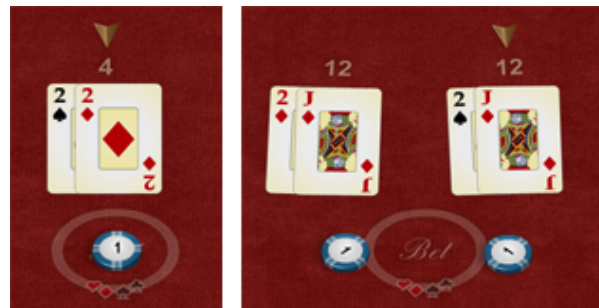
Antes de dividir

Al conseguir dos cartas del mismo valor (por ejemplo dos 8 o un J y una Q), la mano puede dividirse en dos manos distintas. Una nueva apuesta del mismo valor se quitará del saldo y se colocará en la mesa, las cartas se dividirán en dos manos distintas y por cada mano dividida se repartirá una segunda carta. A partir de ese momento, las dos manos se jugarán por separado.