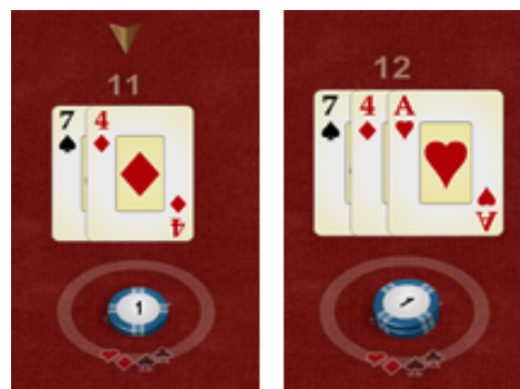
Antes de doblar Después de doblar

La opción DOBLAR se ofrece únicamente con las dos primeras cartas (ver sección "Reglas" para los valores iniciales por los que se puede doblar), siempre que la mano no sea un Blackjack, en ese caso no se ofrece ninguna acción. Al seleccionar el jugador el botón DOBLAR, la apuesta inicial automáticamente se duplica y se quita del saldo. El jugador recibe la carta adicional y la mano acaba.